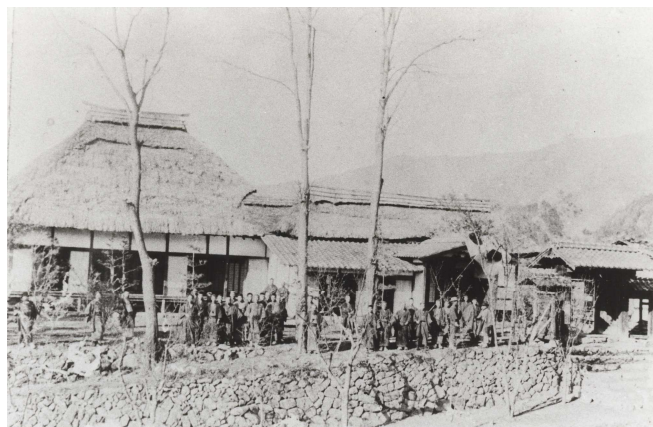
▲ 明治 42 年の進徳館の様子

進徳館には通算 500 人の生徒が学びましたが、藩をあげての学問への取り組みにより、伊沢修二や中村弥六、高橋白山など近代日本や長野県の教育界を支えた多くの優れた人材を輩出しました。学統の確立から生まれた学問と、極めて有能な教授陣を得たことによって、進徳館の教育方針である実学重視の教育はこれほどまでに実績をあげ、高遠藩は小藩ながら長野県内では、北の松代、南の高遠と言われるほどの近代教育の基礎を成したのです。