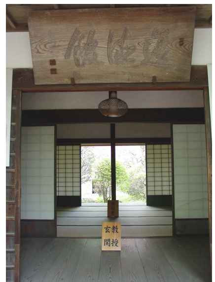
▲ 教授玄関と進徳館額