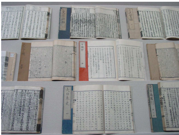
▲ 進徳館より受け継いだ進徳図書