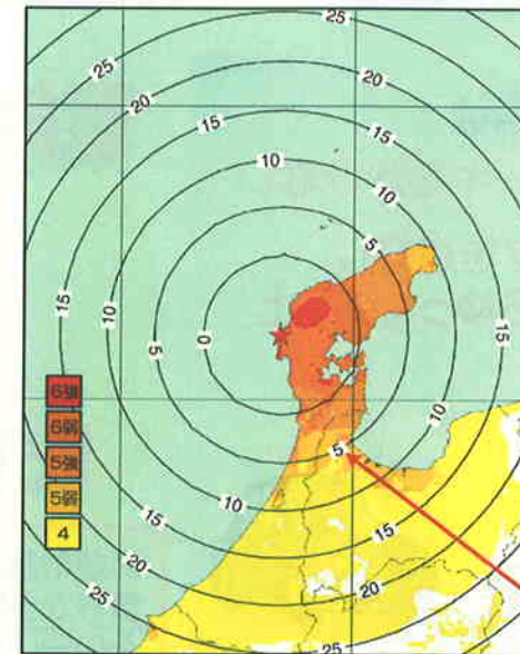
平成19年(2007年) 能登半島地震