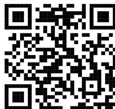
募集中プログラム