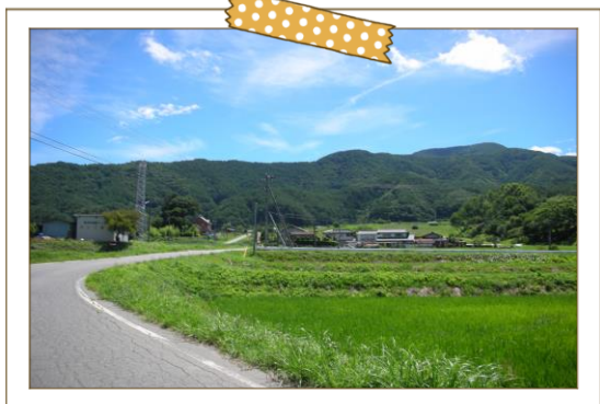
トノボの楽園と里山と、そして集落と

三方を山に囲まれた標高600～800mの丘陵地に清らかな新山川が流れ、水と緑に囲まれた里山地域。キノコ等の山の幸に恵まれ、また、まばゆいばかりの星空など、豊かな自然と人情があります。