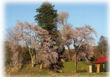
薬師堂のシダレザクラ

地区内に新山保育園、新山小学校、新山集落センター、北新公民館があります。常会ごとに独自の行事も行っています。平成27年に「田舎暮らしモデル地域」の指定を受けました。平成28年には「長野県移住モデル地区」に認定されました。