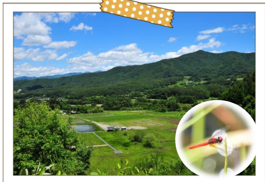
トンボの楽園と里山と、そして集落と

標高800~900mの山あいの集落です。中央を流れる新山川と東西の里山に挟まれたなだらかな丘陵地は、豊かな山菜やキノコの宝庫。40種類を超えるトンボが生息する「トンボの楽園」では、世界最小のハッチョウトンボも飛び交います。市街地から車でたった15分のこの地域には「ふるさとの原風景」があります。地区では「暮らしサポート・子育て応援・住まい整備」の各部会組織を創り、移住希望者のサポートを行っています。