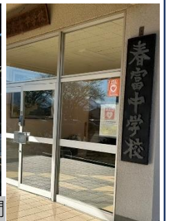
伊那市内中学校訪問