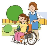
介護サービス事業所