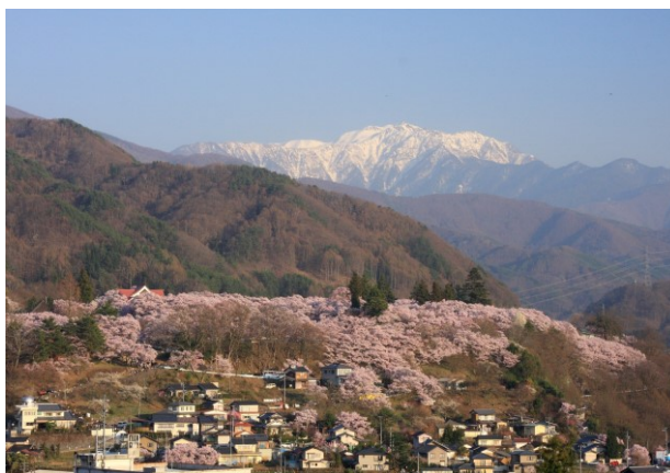
高遠城址公園と南アルプス

「日本で最も美しい村」連合の地域資源の定義は「人々の生活の営みによって作り出されてきた景観、環境、文化」です。地域資源を保全し、活かしながら、共に「最も美しい村」運動を盛り上げていきましょう。