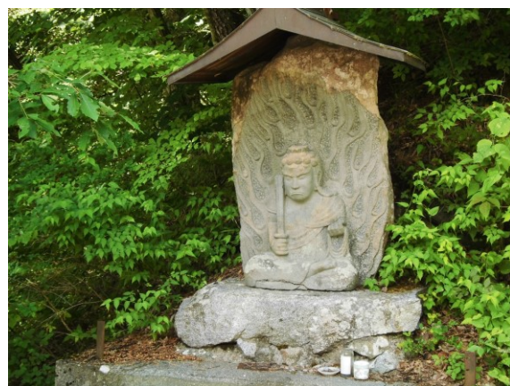
守屋貞治作不動明王