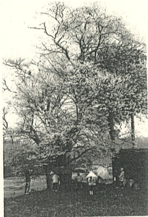
昨年の神事の様子

『鹿の國』は諏訪信仰の一連の神事・行事を扱ったドキュメンタリー映画』であり、「大和の大桜」が登場し、片桐一族の神事の様子が描かれています。