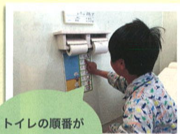
トイレの順番が書いてあるよ

例えば、小学2年生の男の子は職員と一緒に、丁寧な手洗いや歯磨き、鼻をかむ練習をしました。鼻がすっきりかめると「気持ちいいね!」と笑顔がこぼれます。また、ハンカチやティッシュを忘れずに持てるよう、イラストを貼って工夫したり、次に使う人のことを考えてトイレのスリッパを揃えたり。こうした身の回りの小さな「できた!」を積み重ねることが、自分を慈しみ、他者を思いやる心へとつながっていきます。一度で終わらず、日々の暮らしの中で繰り返し丁寧に向き合うことで、子どもたちの行動にも少しずつ変化が見られるようになりました。これからも、子どもたちの「やる気」に寄り添いながら、家庭的な温かさの中で一緒に学んでいきたいと考えています。