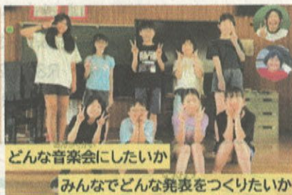
どんな音楽会にしたいか