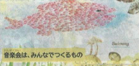
音楽会は、みんなでつくるもの