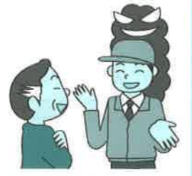
(消費者庁イラスト集より)

を名乗る業者が訪問してきた。安い料金プランの話があり、プラン変更のつもりで申し込んだところ、後で別業者と契約していたことに気づいた。