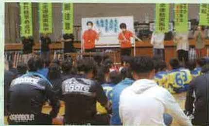
交通安全ジュニアスポーツ大会を開催し、参加者に交通安全教育を実施した。(千曲)