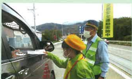
「秋の全国交通安全運動」の活動の一環として、管内の国道で交通少年団による街頭啓発を実施した。(大町)