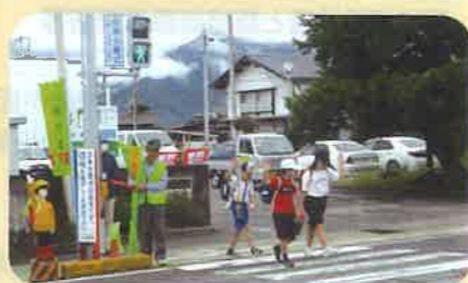
「秋の全国交通安全運動」の活動の一環として、管内の通学路で通学児童への見守り活動を実施した。(池田松川)