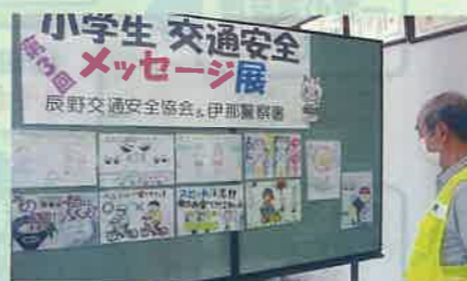
管内の小学生から出展があった交通安全メッセージの審査会を実施した。(辰野)