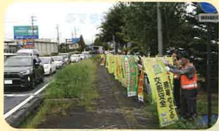
「秋の全国交通安全運動」の活動の一環として、県道長野真田線において街頭指導を実施した。(長野南・松代)