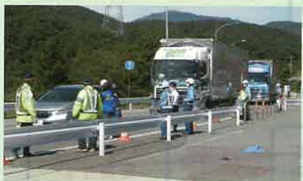
「秋の全国交通安全運動」に伴い、管内の国道152号において諏訪交通安全協会と合同で街頭啓発を実施した。(依田窪・諏訪)