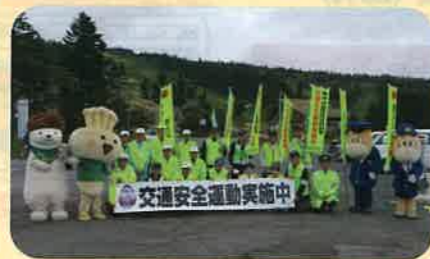
「秋の全国交通安全運動」に伴い、管内の国道において群馬県西吾妻交通安全協会と合同で街頭啓発を実施した。(中高)