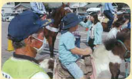
「秋の全国交通安全運動」の活動の一環として、管内の道の駅周辺で「騎馬隊」による街頭啓発活動を実施した。(安曇野)