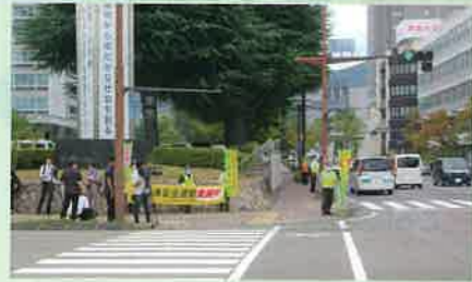
「秋の全国交通安全運動出発式」に併せて県庁前交差点において街頭啓発を実施した。(長野)

交通安全協会は、交通事故をなくすため、様々な活動を行っています。活動の一例を紹介します。