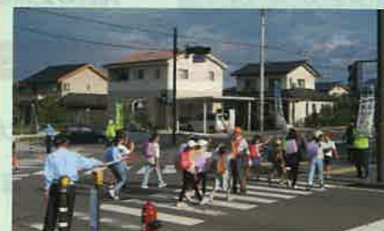
「秋の全国交通安全運動」の活動の一環として、通学路の横断歩道において、小学生に対しルールマナーアップ啓発を実施した。(須高)