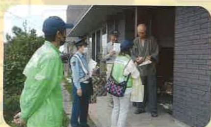
「秋の全国交通安全運動」の活動の一環として、高齢者宅を訪問し交通事故防止を呼び掛けた。(小諸)