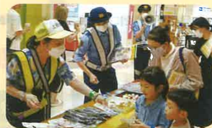
管内の大型商業施設で開催されたイベントにおいて交通安全啓発活動を実施した。(上田)