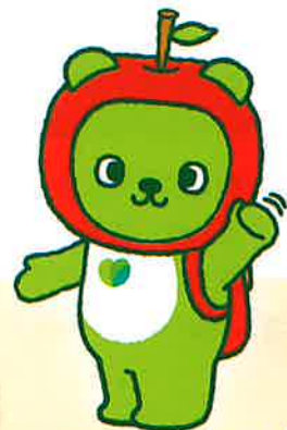
長野県PRキャラクター「アルクマ」