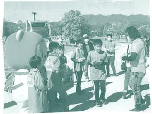
スポーツイベント会場での募金活動