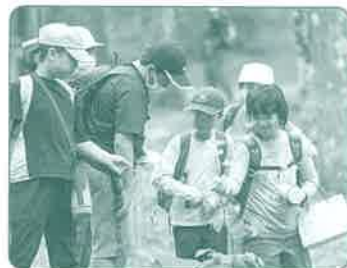
みどりの少年団交流集会