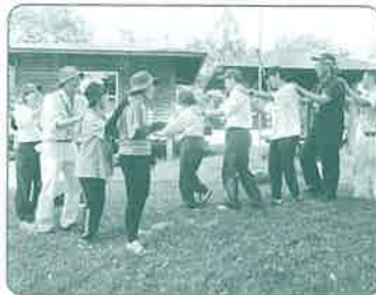
指導者スキルアップ研修会

各地区での身近な緑化活動や、 森林ボランティア団体等を対象とする公募事業、 みどりの少年団の育成などに活用しています。