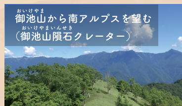
おいげやま 御池山から南アルプスを望む (御池山隕石クレーター)

南アルプスをながめながら、2~3万年前に小惑星が衝突してできた、御池山隕石クレーターの縁を歩くハイキングが楽しめます。