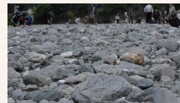
河原での石ころウォッチング