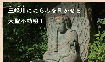
みぶがわ 三峰川にらみを利かせる 大聖不動明王

南アルプスをながめながら、2~3万年前に小惑星が衝突してできた、御池山隕石クレーターの縁を歩くハイキングが楽しめます。