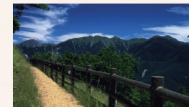
南アルプスの景観や星空を満喫