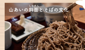
しやめん 山あいの斜面とそばの文化

大鹿歌舞伎は、江戸時代から続く地芝居で、現在も年2回の定期公演が上演されています。