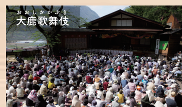
おおしかかぶき 大鹿歌舞伎

大鹿村鹿塩の地では、塩水が湧いており、温泉としての利用の他、製塩も行われています。