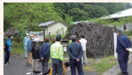
地元による清掃や保存の活動

南アルプスの特徴的な地形や地質、豊かな自然や文化、暮らしを守ることは「地域らしさ」を守ることにつながります。ジオツアーや様々な学習会などで地域の価値を伝えます。