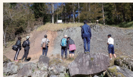
中央構造線露頭での学習

私たちの地域はどのようにして発展してきたのか、大地をベースに様々な特長を学ぶことで、地域の新たな価値や魅力を再発見し、地域のより良い暮らしと未来を考える人を育みます。