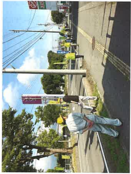
夏の交通安全運動