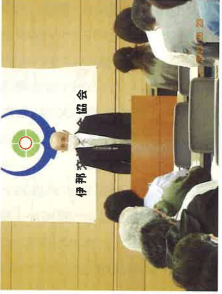
第63回伊那交通安全協会総会