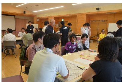
第4回（令和7年8月24日） 「可能性1」スポーツを核とした 官民連携の可能性を探る！