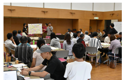
第6回（令和7年10月12日） 多様な学びとは？ ～「学びの新しい当たり前」を一緒に考えよう～