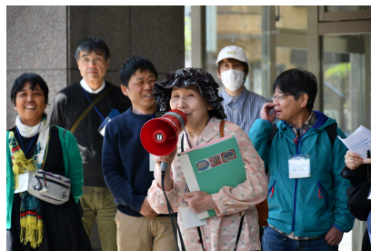
第2回（令和7年4月26日） 伊那弥生ヶ丘高校ツアーと 自然や地形から学ぶまちづくり