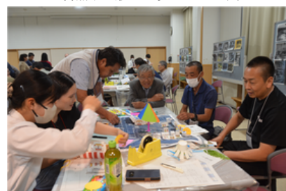
第5回（令和7年9月23日） 高校生と考える今やりたいこと 「駅前ちゃんじ」！