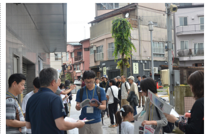
第3回（令和7年6月15日） まちなかエリアの魅力や課題を 見る会