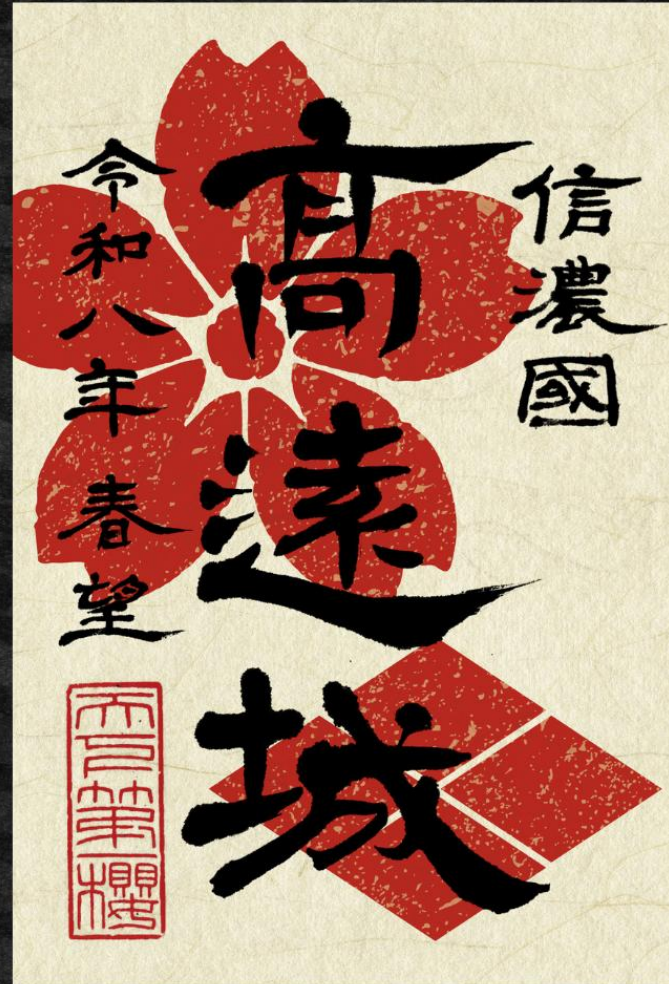
表 信濃國高遠城 天下第一櫻 書 藤井璃石 印 泉石心