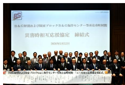
締結後の写真撮影のイメージ

具体的な内容としては、「避難者収容及び応援受援等を目的とした海洋センターをはじめとする公共施設の提供」「防災拠点事業にて整備した車両及び資機材等の提供」「応急対策に必要な職員の派遣」等を含む7項目が設定されています。締結式では、39 市町村長（48 市町村のうち代理出席 9 自治体を除く）、B & G 財団常務理事の 40 名による協定書への署名を行います。