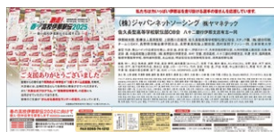
過去の新聞掲載内容