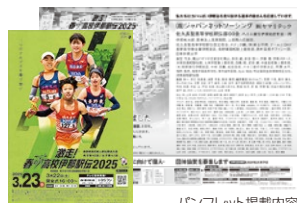
パンフレット掲載内容