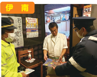
伊南 飲酒運転防止パトロール