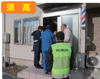
須高 高齢者宅訪問