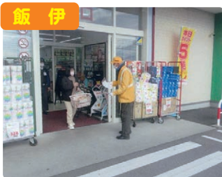
飯伊 交通死亡事故抑止対策