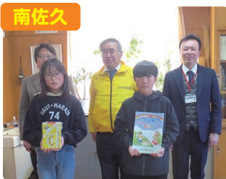
南佐久 新入学児童への安全冊子贈呈式