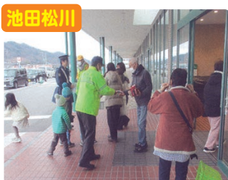
池田松川 街頭啓発活動