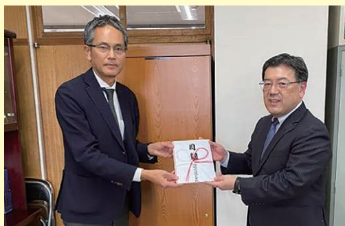
「信越放送株式会社」様

令和7年9月に、日本生命保険相互会社 長野支社・松本支社様より、また、令和8年1月には、信越放送株式会社様より、当交通安全協会が実施しております交通安全広報啓発活動等の一助として、寄付金を贈呈いただきました。交通安全協会では、いただいた寄付金を今後の各種交通安全啓発活動に有効活用して参ります。