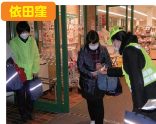
依田窪 ピカピカペタンコ作戦