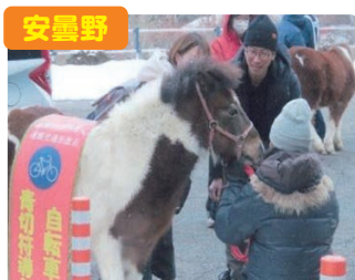
安曇野 午年の啓発活動