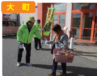
大町 交通死亡事故緊急抑止対策