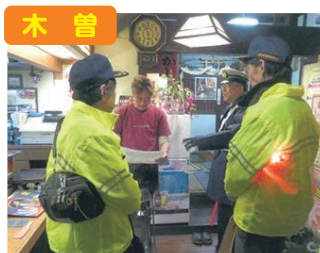
木曾 飲酒運転防止パトロール