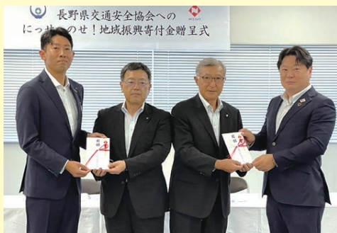
「日本生命保険相互会社 長野支社・松本支社」様