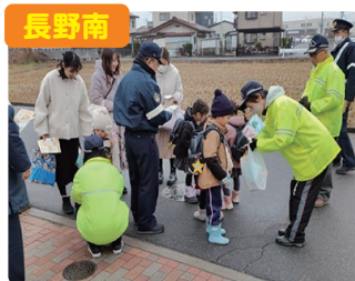
長野南 幼稚園児への交通安全指導