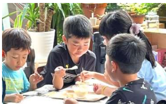
本物の焼き芋の味と香りがしっかり味わえるソフトクリームでした。