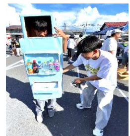
ジュース自販機ロボット？