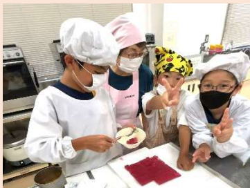
ゼリーを作りました。