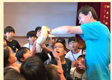
ボールニシキヘビにさわりました。