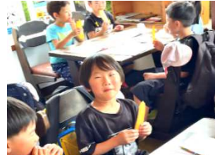
低温で3時間かけて焼いた「お芋チップス」を食べました。