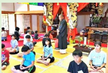
常光寺さんでの座禅体験