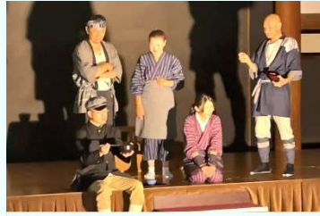
劇「入野谷郵便」を観ました。