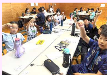
プラバンのアクセサリ作り