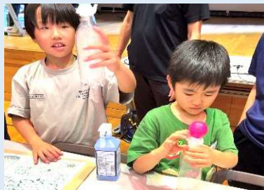
ペットボトルで雲を作る実験