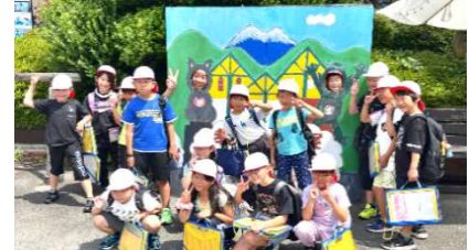
お店の前で、みんなで記念撮影！