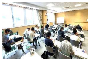
真剣に学習しています。