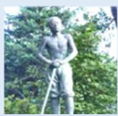
少年の塔(伊那公園)