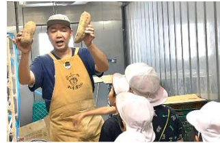
サツマイモを冷蔵保存している倉庫に特別に入らせてもらいました。