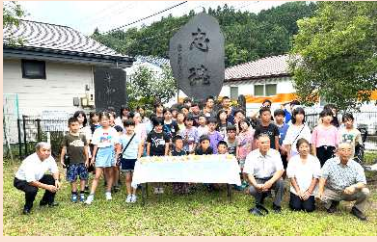
忠魂碑に献花した後、記念撮影