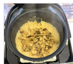
じゃあ〜ん、できあがり！