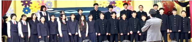
混声4部合唱 いつまでも 中学全校

長谷小学校の体育館には、小学生・中学生・保育園の年長さん・高遠高校合唱部の皆さんが集い、保育園から高校生まで幅広い年齢の演奏を聴く貴重な機会となり、保護者や