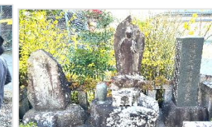
青島遊園地の堀内家屋敷跡