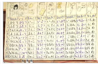
難しい表現も、ひと目で分かります。