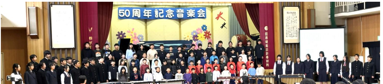
最後の演奏 賛歌-長谷 全員合唱 この後、児童・生徒・職員・保護者・地域の皆さん、全員で記念撮影をしました！

地域の皆さんも惜しめない拍手を送りました。素晴らしい演奏と共に、改めて長谷地域の良さや一体感が印象に残った音楽会でした。