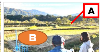
A: 堤防が切れているところ B: 水が、一旦たまる場所