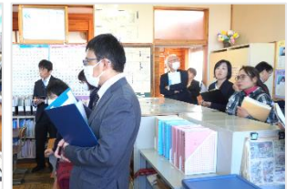
日本語教室も参観しました。