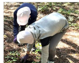
一生懸命に、まつたけを探しますが、なかなか見つかりません。