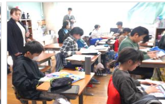
「自動車工場の多いところは？」