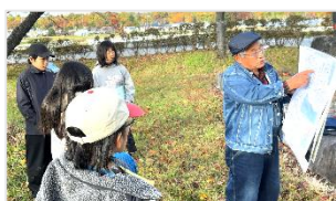
三峰川が曲がりくねって流れていることを説明しています

毎回のクラブで、地域の素晴らしいことをこんなにたくさん知ることができて、とても羨ましく思いました。