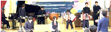
合奏 StaRt 混声2部合唱 Soranji 中学1年生