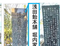
浅田飴本舗 堀内家屋敷跡