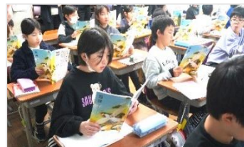
「ごんぎつね」のリレー読み