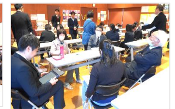
「DLA」について、情報交換