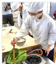
ホウレンソウをゆでて、お吸い物を作りました。