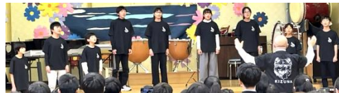
混声2部合唱 いのちの歌 合奏 カルメンより前奏曲 小学6年生

長谷小学校の体育館には、小学生・中学生・保育園の年長さん・高遠高校合唱部の皆さんが集い、保育園から高校生まで幅広い年齢の演奏を聴く貴重な機会となり、保護者や