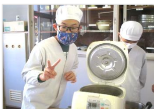
「ぱっちり、炊けているよ。」