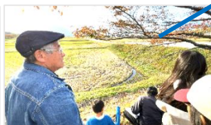
通称ナイスロードの説明中です。