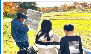
霞堤防と地図を見ながら説明