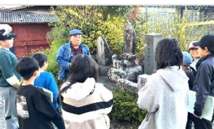
「浅田飴」をもらって、堀内家のお話を聞きました