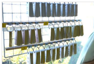
単語カードが、すぐに使えます。