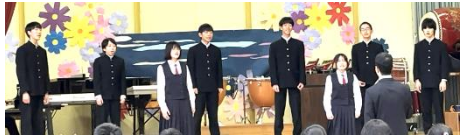
混声3部合唱 手紙～拝啓十五の君へ～ 中学3年生