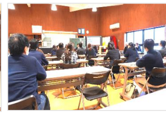
授業研修会 全体協議の様子