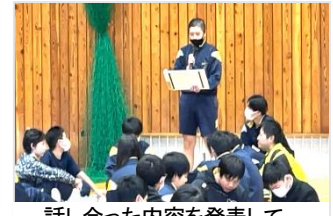
話し合った内容を発表して、全校で共有します。

いうことについて討論し、日々の生活の中で気をつけて行くことを全校で確認しました。また、個々には教室に帰って「振り返りフォーム」に入力して、自分の考えを整理しました。西箕輪中学校の皆さんは、人権問題やいじめ問題について、年間を通して各自が意識をもって生活をしていることがよく分かりました。