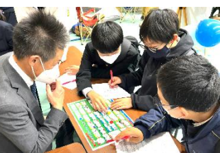
ジブラルタル生命保険(株)