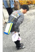
地域の人に挨拶をするミッション