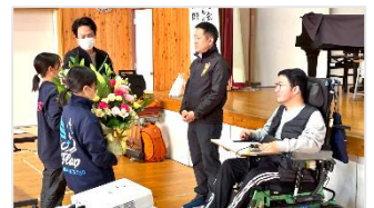
児童代表から、お礼の言葉と花束贈呈が行われました。