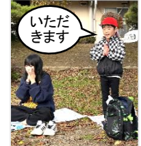
お昼のご飯の挨拶係は、1年生