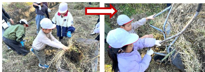
刈った草を一輪車にのせます。