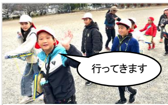
6班から間隔を置いて、出発

このように、「手良の自然に親しむ日」は、子どもたちが自分たちで考えて作り上げる子どもたちが主人公の行事であり、異学年の友だちともっと仲良くなり、手良の文化財や自然に触れて地域を知って地域に親しむ、充実した行事でした。