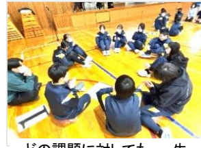
どの課題に対しても、一生懸命に考え、話し合います。