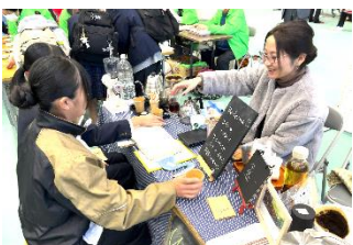
風雲 Coffeeroastery & Books