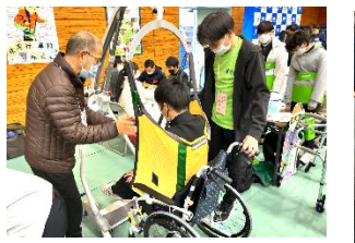
老人保健施設 すずたけ