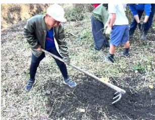
お花を植える場所を作ります。