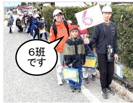
引率は6年生、旗は3年生作