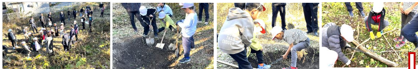
草刈りをして、平らにしました。

文組の児童たちは、これまで自分たちの身長より高い草が茂っていた藪を切り開き、バタフライガーデンをつくってきました。この日は花壇や池をつくる活動が行われ、穴を掘ったり、草の根を掘り出したり、草を運んだり、階段をつくったりと、それぞれの活動への意欲が感じられました。先生が終わりを告げると、一斉にもっとやりたい「え〜。」という声が上がりました。