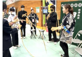
まつり芸能集団 田楽座