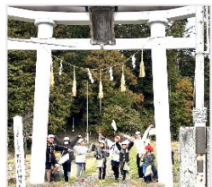
八幡神社でミッション