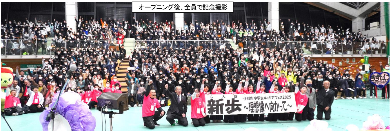
オープニング後、全員で記念撮影

市内6中学校から生徒実行委員に選出された12名の皆さんは、3月からキャリアフェス体験者の先輩や大人から情報を集めて5月の第1回実行委員会に参加し、そこから大人実行委員や市教委の皆さんのアドバイスも受けながら準備を進め、当日を迎えました。（詳細は伊那市HP「キャリアフェスだより」参照）参加した中学2年生の皆さんは、大人との語らいや仕事の内容から、自分の将来を考え、地域を知る機会となりました。