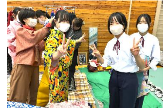
普段着きものを楽しむ店 萌黄屋