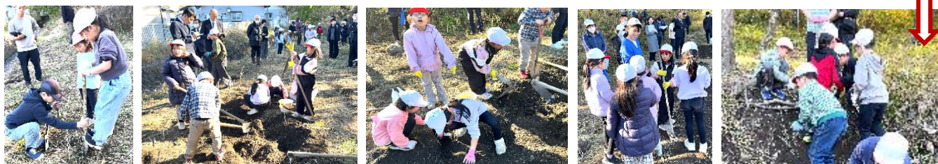
硬い地面を体重使って掘ります。