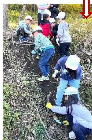
斜面の両側に、蹴上げの棒を打って、踏み棒を止めるようにします。