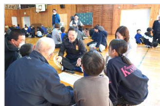
「助け合いすごろく」をやりました。