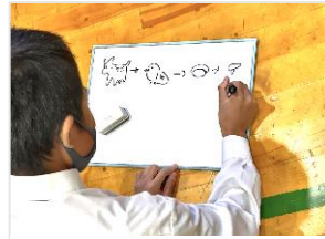
アイスブレイクの「絵しりとり」

問題や人種問題等について、さらに「西箕輪中学校の集会での並び方」について討論をしました。最後に、「日常生活の中で知らず知らずに人を傷つけている行動はないか」と