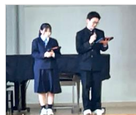
2時間にも及ぶ討論会を、協力して進めてくれました。