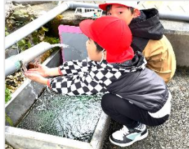
鳥の宮用水の水を飲むミッション