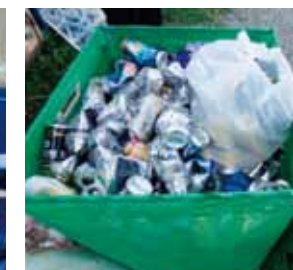
袋に入れたまま出さない