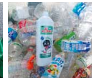
ラベルをとる、マークを確認