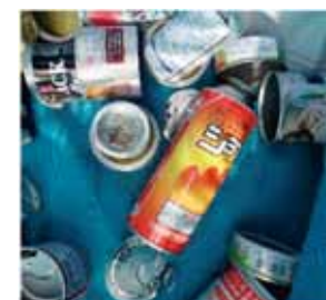
ガスボンベは「燃やせないごみ」

ラベルやキャップがついたままのペットボトルや、分別が間違っているものが多い見られます。きちんとルールを守りましょう。