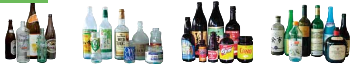
1 生きびん 2 白色(透明)びん 3 茶色びん 4 その他の色びん

飲料、食料品、調味料など人が飲んだり食べたりしても害のない商品が入っていたガラスびんが対象です。