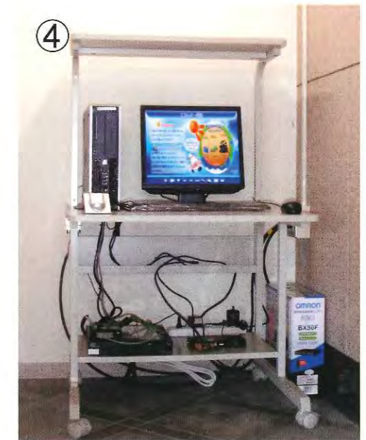
屋外モニター 発電量をリアルタイムで表示します。