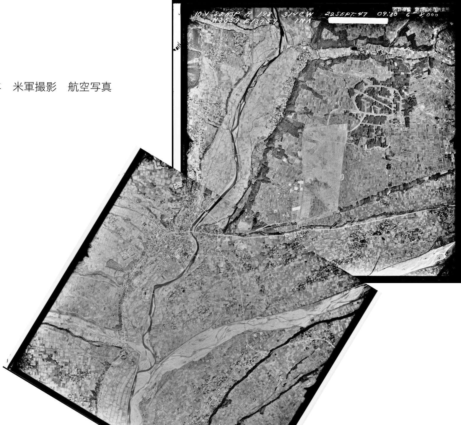
昭和22年 米軍撮影 航空写真