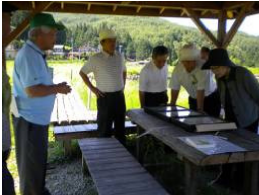
▲新山地区で、日本一小さなトンボ“ハッチョウトンボ”を含むトンボの生息地を観察した。

各委員から推薦のあった地元の自然、歴史、文化などに関する「いいところ（見てもらいたい場所等）」のうち、「トンボの楽園」、「信州高遠美術館」、「三峰川堤防の霞堤と桜並木」について現地視察を行いました。また、「いいところ」の解説は委員自身が行うなど、実践活動の成果を披露する機会となりました。