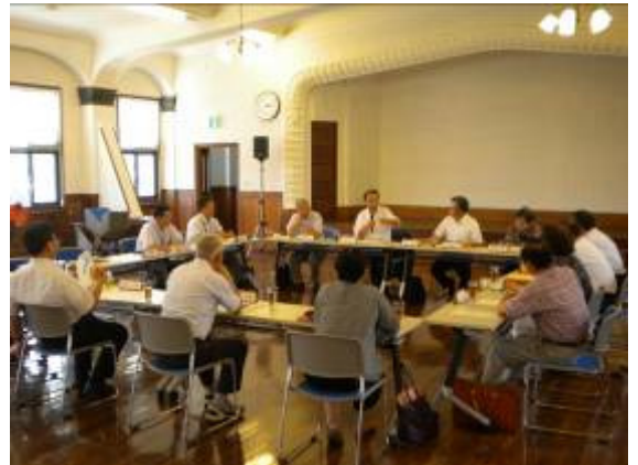
▲創造館で開催された市長との懇談会。猛暑の中、真剣な議論が行われた。

懇談では、「地域の活性化は自分たちの地域を知ることから始まる。つぶさに知ることによって地域に誇りが生まれる。誇りが生まれれば、活性化は自ずと始まる。」「保育園では当たり前のことのできる子どもを育てよう」と取り組んでいる。」などの市長談話（主旨）や、社会教育委員ならではの地域に密着した現場からの意見が交わされ、行政と地域それぞれの視点で議論を深め、委員から定例化を望む声が出るほど有意義な懇談となりました。