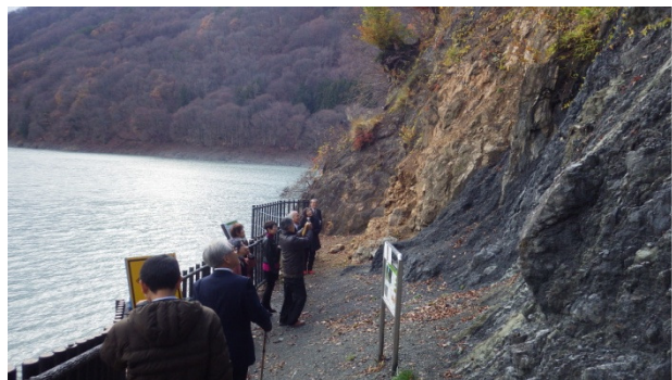
▲ 長谷 溝口露頭 中央構造線が見える崖

「まほら伊那いいとこ百選」に選ばれている狐島の蓮台場には、村人の危難を救おうと自ら墓杭を掘って中に入り、生涯を閉じた北山和尚が埋葬されたお墓があります。