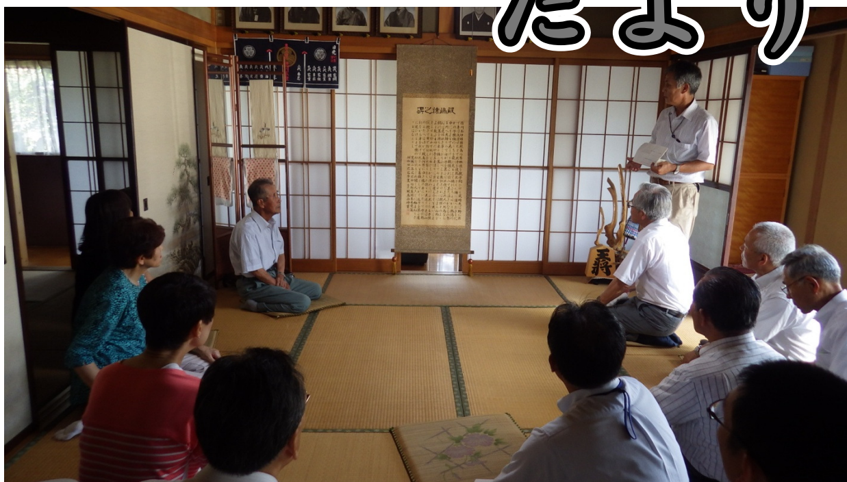
▲ 「社会教育委員発！我がまちいいところ10選」伊那市東春近に伝わる殿島猿の民話について説明を受けました。