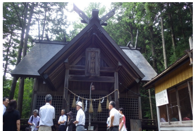
▲ 西箕輪 第六天西山神社

「まほら伊那いいところ百選」の第六天西山神社について、氏子総代の方からの説明を聞きました。