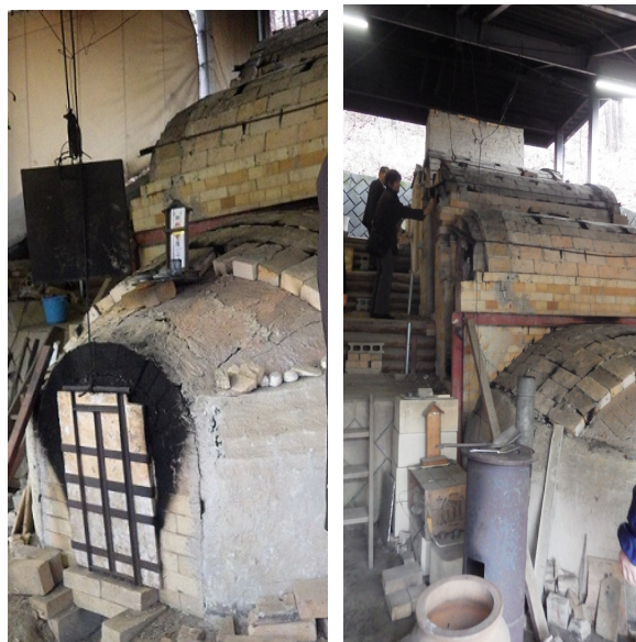
▲ 高遠町勝間 高遠焼 白山登窯 ▲