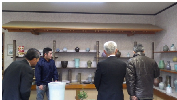
▲ 高遠町勝間 高遠焼

野口区にある八幡神社舞台は、江戸時代末期頃に建てられ、伊那市に現存する農村舞台では大規模なものになります。農村舞台を基盤に地芝居が盛んだったことが窺えます。