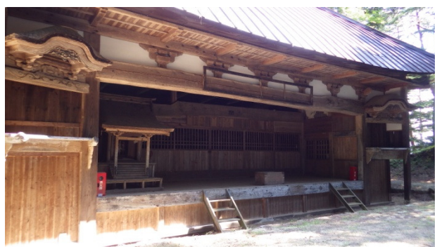
▲ 手良野口 野口八幡神社舞台

高遠焼は昭和50年に町営「高遠焼」として再興し、平成7年に勝間の白山の地に築いた登り窯と作品について、白山登窯の方から説明を受けました。