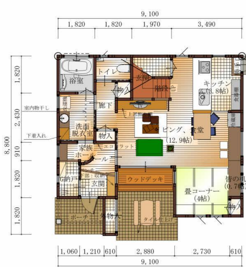
1階 平面図 S:1/100