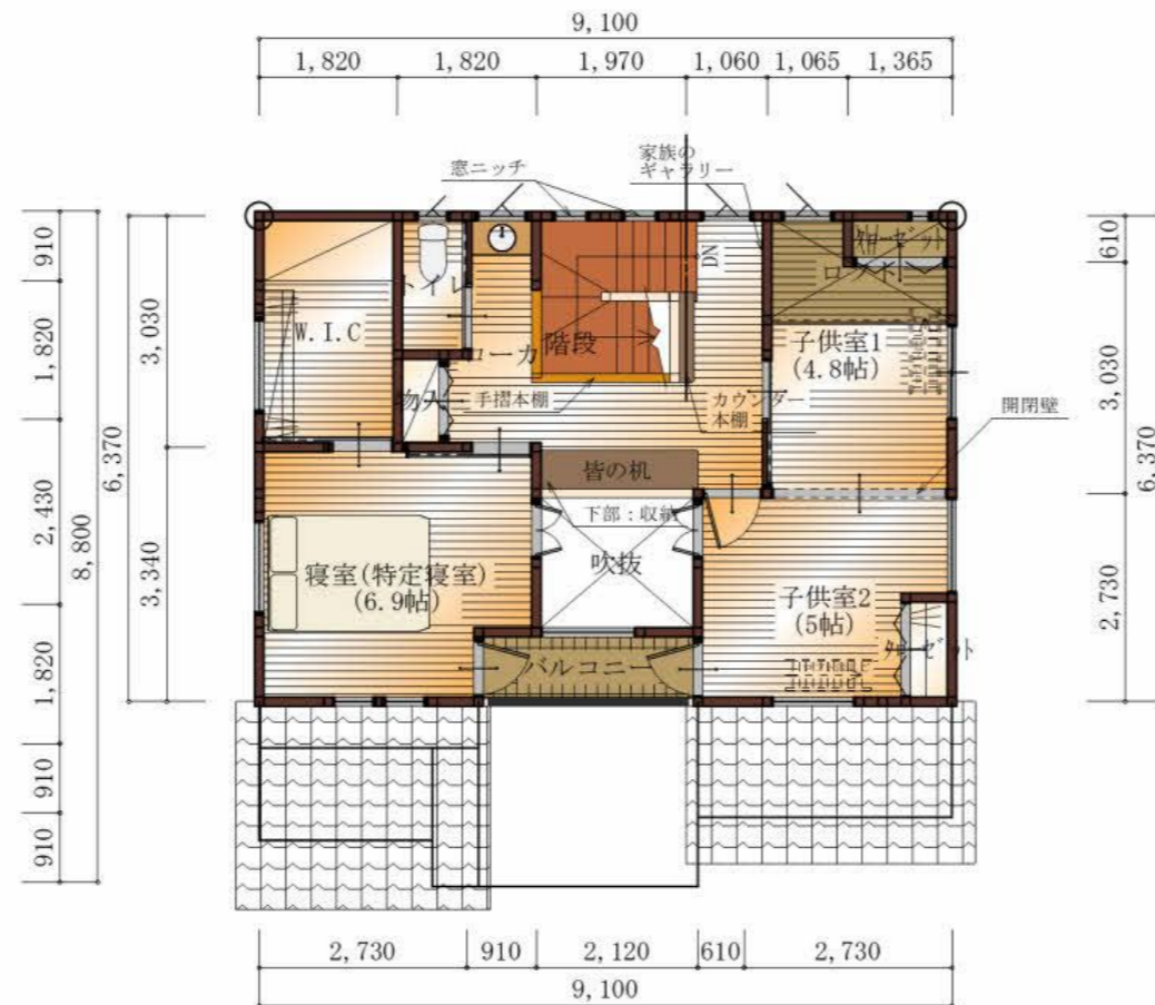
2階 平面図 S:1/100