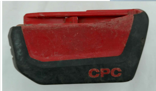
HILTI バッテリー (B14/1.6 Li-Ion, シリアルナンバー0082119)