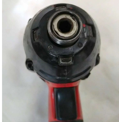
インパクトドライバー