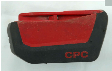
HILTI バッテリー (B14/1.6 Li-Ion, シリアルナンバー2607828)