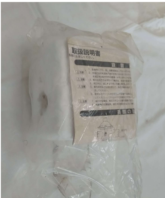
箱に収納した際の写真