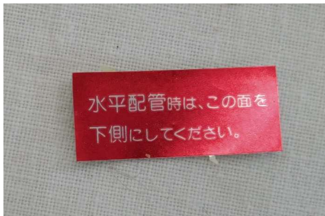
はがれていたシール