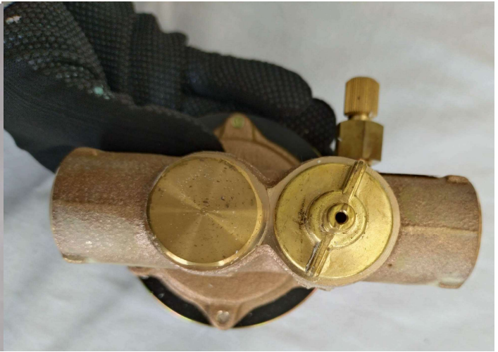
水道用減圧弁本体