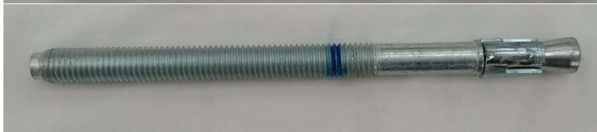
HILTI HSA M12×175 95/80/45 1本