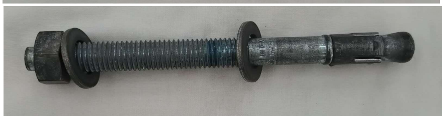
HILTI HSA M12×145 65/50/15