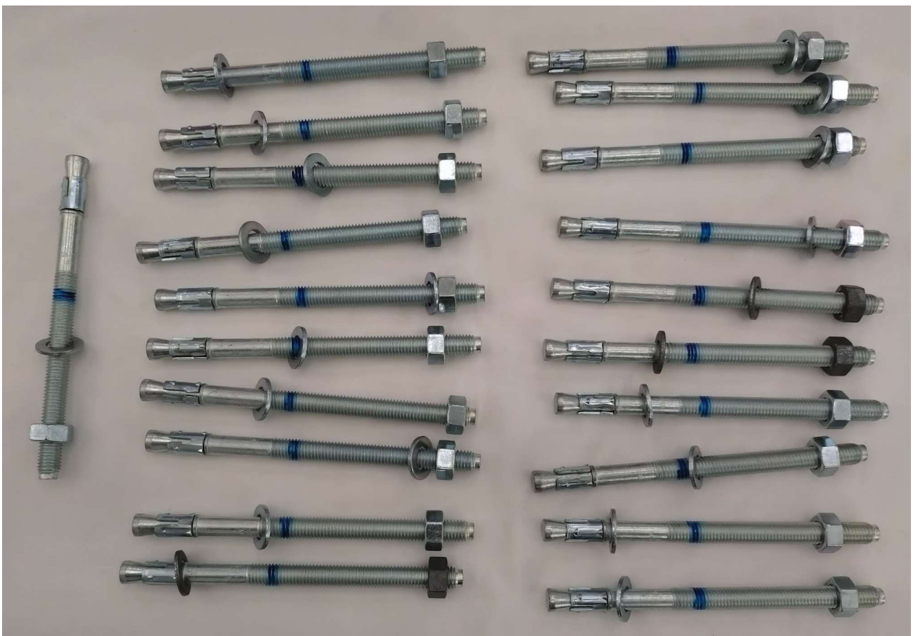
HILTI HSA M12×175 95/80/45 24本中21本