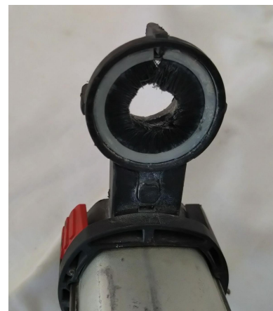
ダストリムーバー