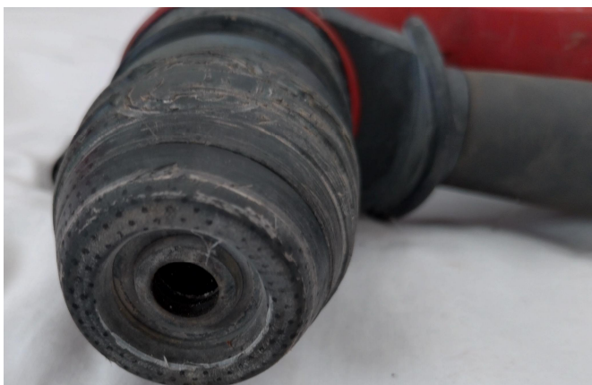
ロータリーハンマー