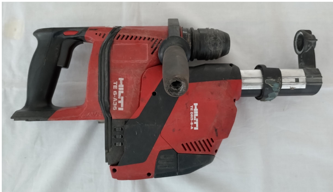
ロータリーハンマーとダストリムーバーをセットした際の写真