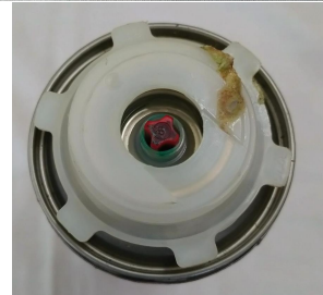
HILTIウレタンフォーム (CF-I750/G)