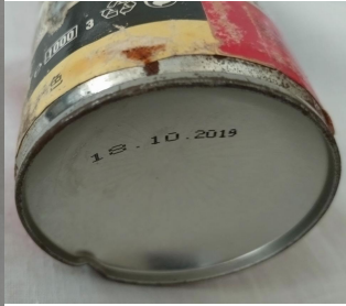
HILTIウレタンフォーム (CF126)