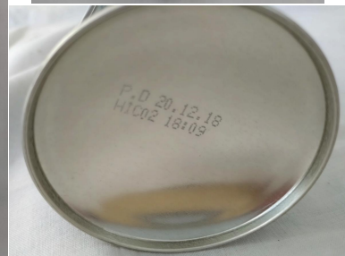
ワールドクリーナー