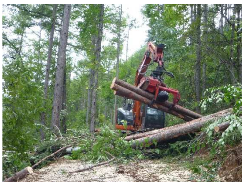
（事業1：作業中の様子）