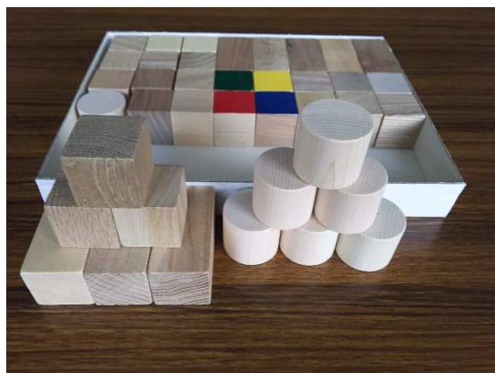
（誕生祝い品（キューブ積木））