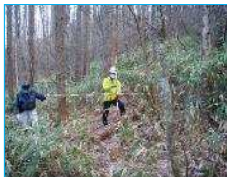
（事業1：作業中の様子）