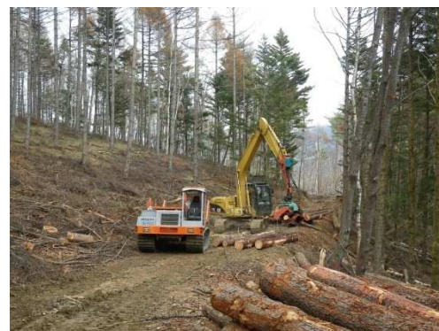
（事業1：作業中の様子）