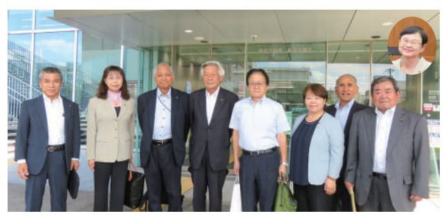
人口減少対策特別委員会委員

今 後は、市民や事業者、関係団体と連携し、「誰もが能力を発揮しやすい環境づくりにつながるよう、意識啓発や理解促進に取り組むことが重要である。」と、当委員会では結論をまとめました。 取り組みにより、より多くの転入者を増やすことで人口減少を少しでも緩やかに推移させる方向性が大切であると考えます。