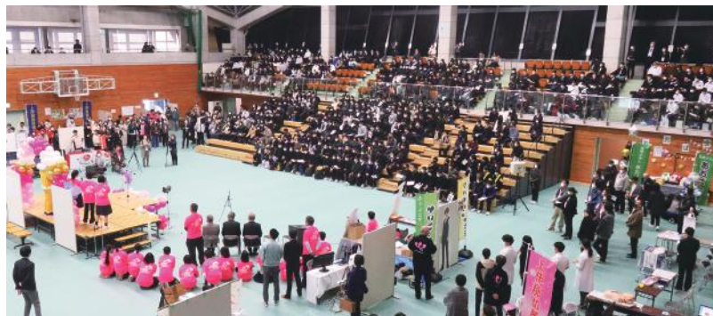
エレコム・ロジテックアリーナでのオープニング