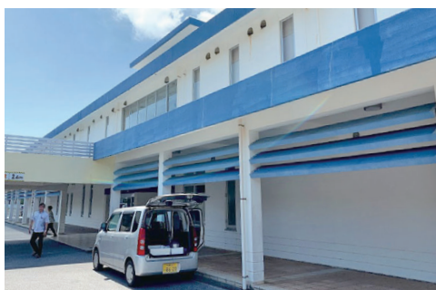
マルチメディア館

金融IT国際みらい都市構想を掲げ、全国で唯一「経済金融活性化特別地区」の指定を受けています。災害が少ないという優位性で企業誘致に取り組んでおり、10年間で49社の誘致・1163人の雇用を生んでいます。企業のBCP(事業継続)が叫ばれている中、企業誘致施策に大いに活かせる視点を学びました。