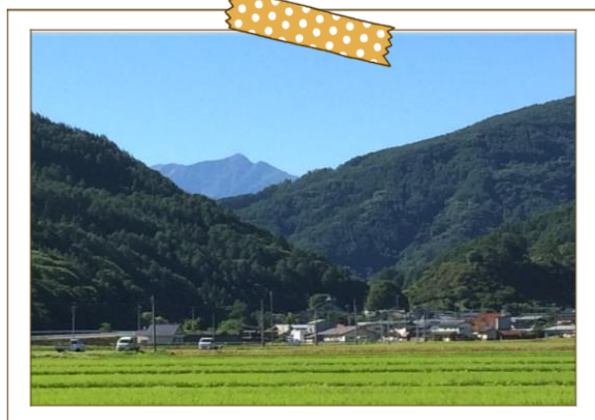
集落と百名山 塩見岳

分杭峠の麓に位置し、孝行猿の里、市野瀬古城址で知られている。 春先の城山のツツジは小山一面に咲き誇り見事。 人情豊かな住民と谷合の静かな農山村集落。