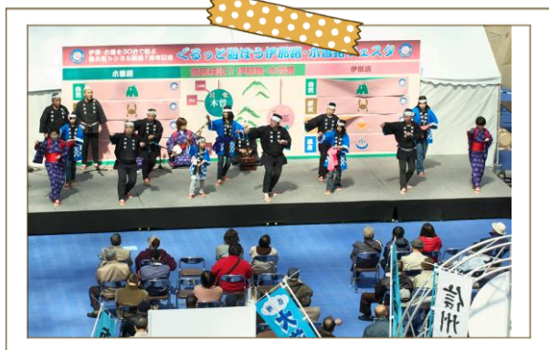
300年近く踊り継がれる「与地の伊那節」

伊那谷に伝わる民謡「伊那節」発祥の地。南アルプス、中央アルプスを一望できる風光明媚な山里で、自然と調和した伝統や文化があり、静かで穏やかな地域です。