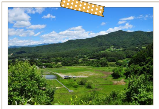
トンボの楽園と里山と、そして集落と

標高800~900mの山あいの集落です。中央を流れる新山川と東西の里山に挟まれたなだらかな丘陵地は、豊かな山菜やキノコの宝庫。40種類を超えるトンボが生息する「トンボの楽園」では、世界最小のハッチョウトンボも飛び交います。市街地から車でたった15分のこの地域には「ふるさとの原風景」があります。地区では「暮らしサポート・子育て応援・住まい整備」の各部会組織を創り、移住希望者のサポートを行っています。