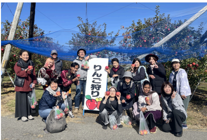
秋にみはらしファームのりんご狩りへ行きました