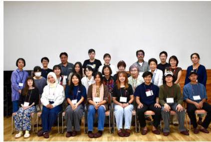
市街地で開催した前期「い〜な」の最終日