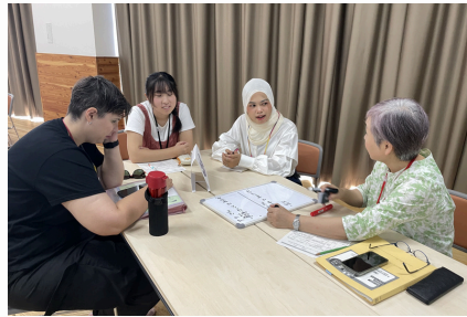
グループごとにたくさん話します。地域の高校生も参加しました。