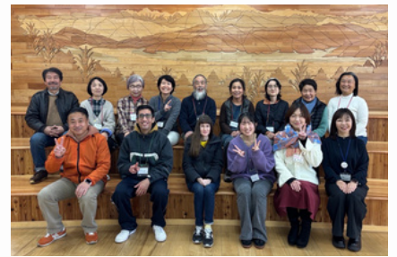
西箕輪エリアで開催した後期「い〜な」の最終日