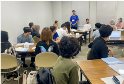
初回は19人と多くの方が参加しました。