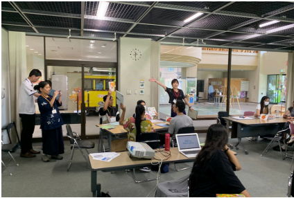
多くの学習者が初めて図書館を利用したとのことでした