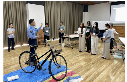
警察署の方に交通安全をテーマにお話をいただきました