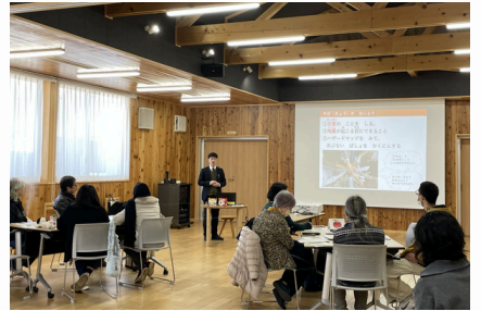
市役所危機管理課の方には伊那地域で起こる災害についてお話をいただきました