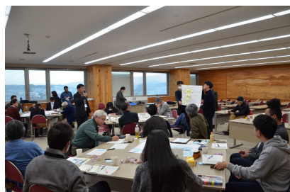
第7回（令和7年11月30日） まちなか作戦会議 「やりたい」を実現するために