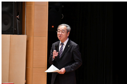
第1回（令和7年1月26日） キックオフイベント