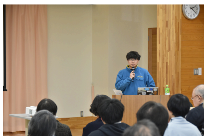
第8回（令和8年1月18日） 持続可能な公共空間 一歩くらがつくるパブリック