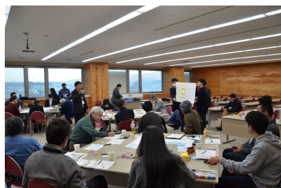
第7回（令和7年11月30日） まちなか作戦会議 「やりたい」を実現するために