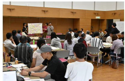
第6回（令和7年10月12日） 多様な学びとは？ ～「学びの新しい当たり前」を一緒に考えよう～