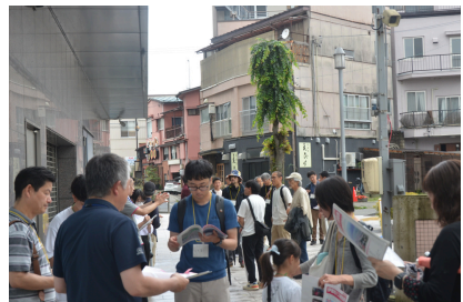
第3回（令和7年6月15日） まちなかエリアの魅力や課題を見える化しよう！