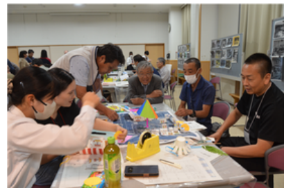
第5回（令和7年9月23日） 高校生と考える今やりたいこと 「駅前ちゃれんじ」！