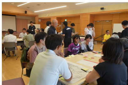
第4回（令和7年8月24日） 「可能性1」スポーツを核とした 官民連携の可能性を探る！