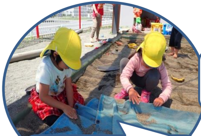
砂場のカバー（メッシュ地）を利用し、ふるいの様にして細かいサラサラ砂を作ります。