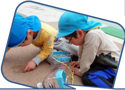
ダンゴムシを捕まえてじっと観察！「まて、まて～」