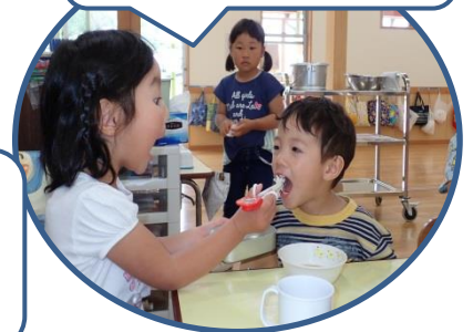
年長さんが年少さんのご飯のお手伝い！「はい、ア～ン！」

子ども達は遊びや生活の中で様々なことを学んでいます。いつも遊んでいる遊具だけでなく、そこにあるものを使ってイメージを膨らませ、試したり工夫したりして遊んでいます。また、年上の子が年下の子の面倒をみたり、年上の子の遊びを真似するなど、生活や遊びが伝承されており、経験、体験の大切さを感じます。これからも子ども達がいろいろな体験をし、不思議がったり、面白い「がるがるっこ」をしっかり育てていきたいと思えます。