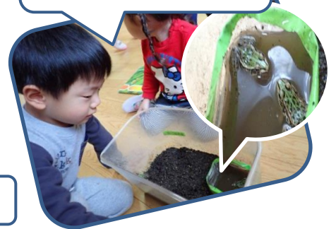
「見て！カエルさんがお風呂に入って話してるよ！」

子ども達は、身近な小さな生き物たちにとっても興味関心が高く、「見たり」「触れたり」して様子を観察しています。少し抵抗のある子もありますが、友だちが楽しそうに触れ合っているのを見たり、エサをあげたりすることで親近感がわき、愛情を持って関わるようになっていきます。一番小さい0.1歳児さんも、生き物たちが動くと「おっ！」と嬉しそうな表情で指差しています。興味を持つと共に、命の大切さもしっかり伝えていきたいと思えます。