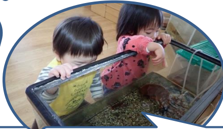
未満児さんも興味津々…「いた！」