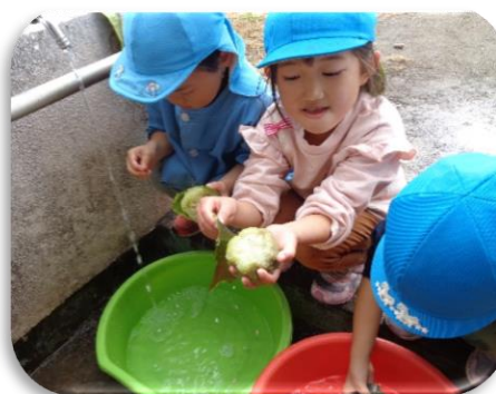
茹でたヘチマの皮を剥きました。 「ヌルヌルするね〜」