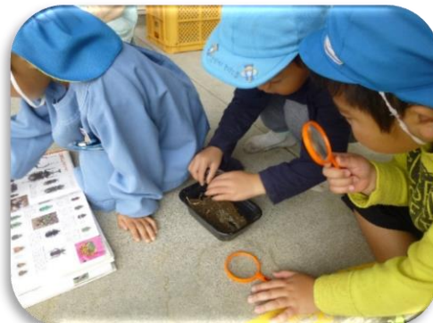
虫が大好きな年長さん。虫メガネでじっくり観察。図鑑で調べます。