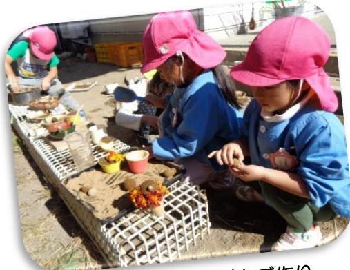
赤土を上手に丸めておだんご作り。 ごちそうが並びました

子どもたちは登園するとすぐに園庭に飛び出していきます。澄み切った青空の下、バッタやトンボを追いかけたり草花や木の実を使ってごちそう作りをしたりと秋の自然に触れながら思い思いの遊びを楽しんでいました。今は、ドッジボールや鬼ごっこ、かくれんぼなどの遊びや泥だんご作り、ごちそう作りなども盛んです。未満児さんから年長さんまで、園庭で元気いっぱい遊んでいます。