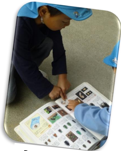
「これじゃない？」 「ほんとだ！似てるね」