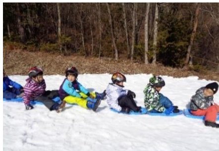
長くつながったり、横に並んだり。いろいろな滑り方を楽しみました