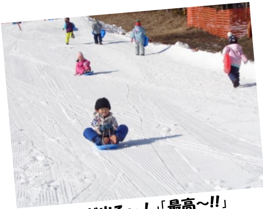
「スピードが出る〜!」「最高〜!!」