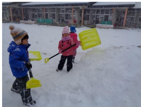
「かまくら作ろう!」雪を積んでいきます