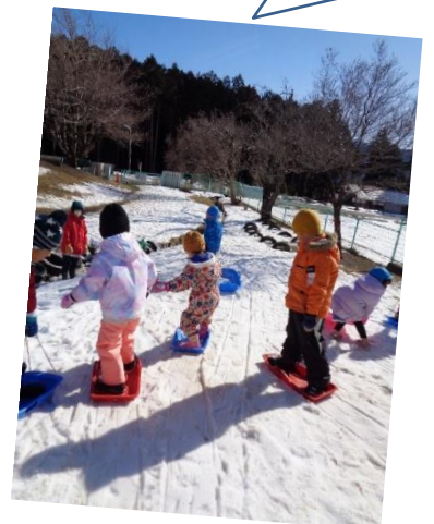
ソリに立って乗って、 スノーボードに挑戦!