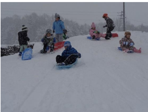
雪が降りしきる中、そり遊び。「行くよ〜!」