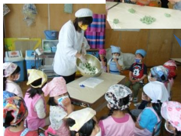
自分達で摘んできたよもぎを使ってよ もぎだんごを作りました。ほんのりヨ モギの香りがとってもおいしかったで