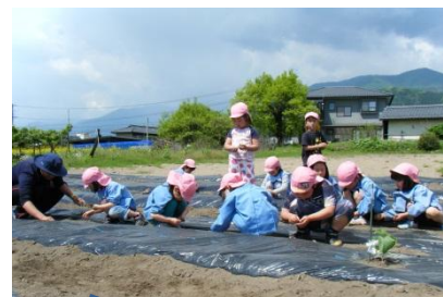
年長さんの畑作り オクラの種を蒔きました。