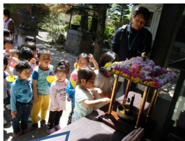
お花まつりにお呼ばれまし