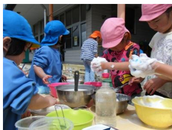
あわあわ作りに夢中です